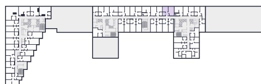
Место на этаже