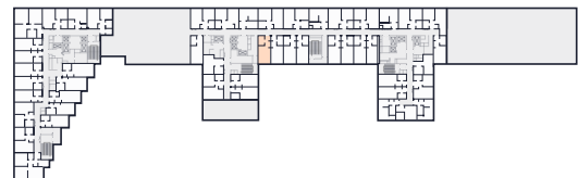
Место на этаже