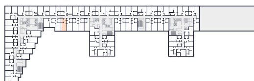
Место на этаже