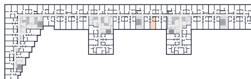
Место на этаже