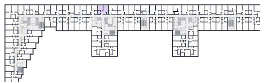
Место на этаже